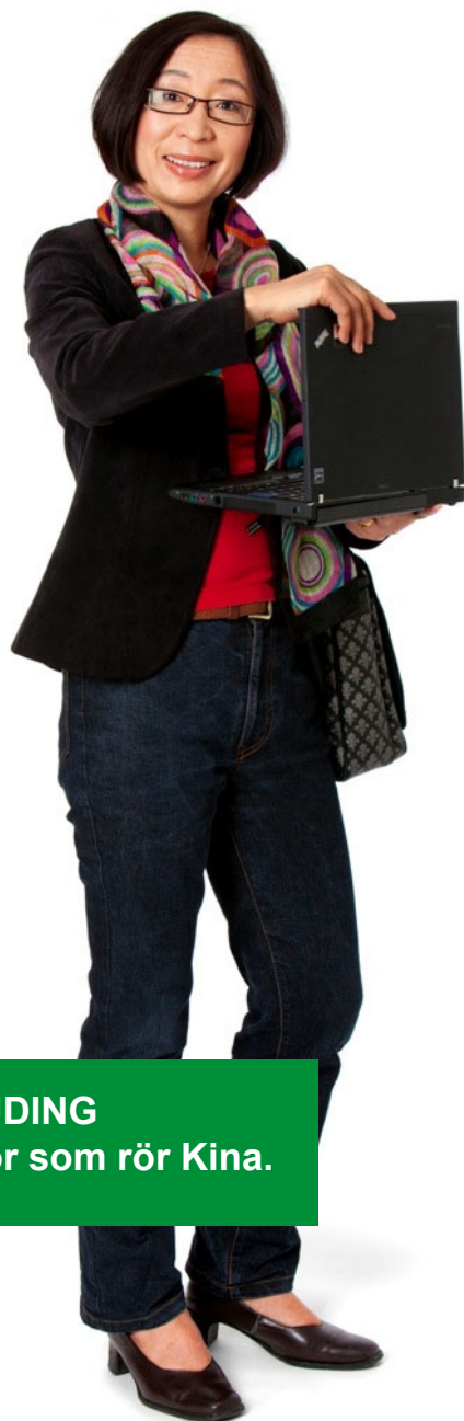
PING HÖJDING Miljöfrågor som rör Kina.